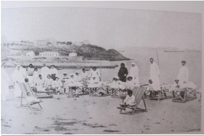
Sanatorio Marítimo de Oza

Santiago de Compostela, 12 de diciembre de 2013